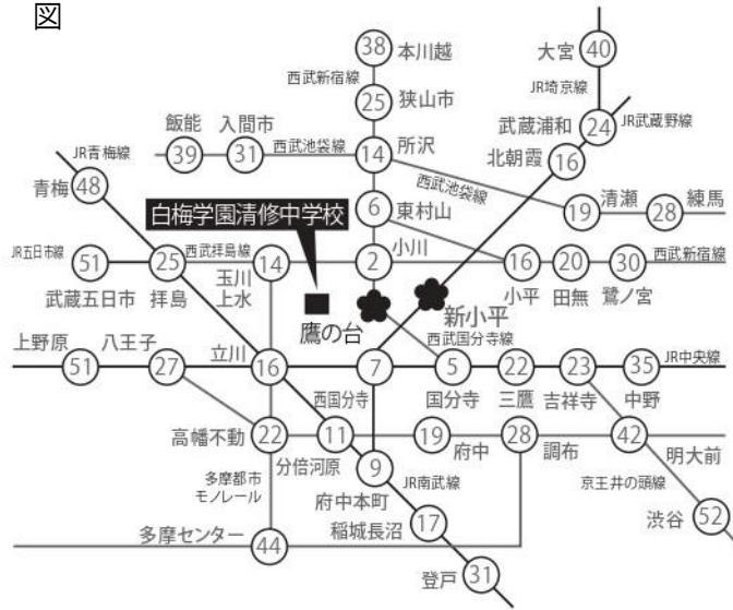
○西武国分寺線「鷹の台」駅・JR武蔵野線「新小平」駅までの所要時間